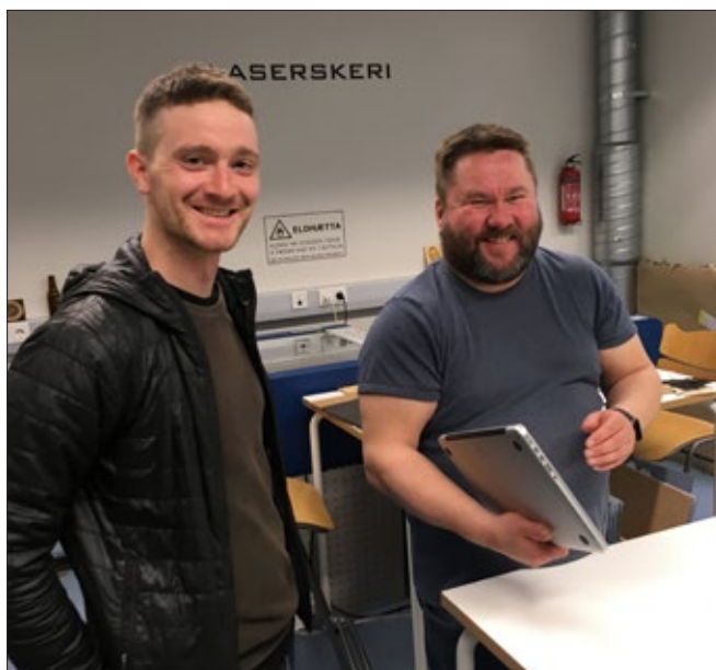
Gestir og sjálfboðaliðar höfðu í nógu að snúast á fyrstu vinnustofunni sem haldin var í mars sl.