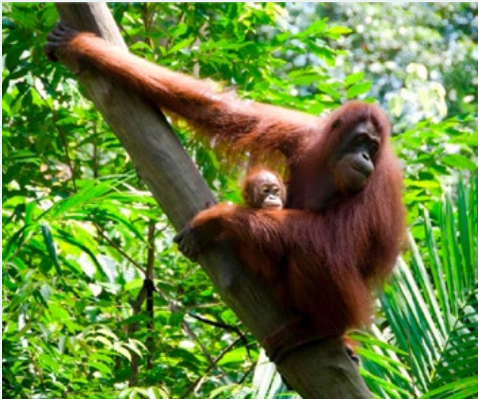
Heimkynni Órangútana eru rengskógar Borneó og Súmötru. Vegna ágangs mannsins eru orangútanar nú í útrýmingarhættu.

Framleiðsla á pálmolíu hefur margfaldast á undanförunum áratugum. Árið 1995 var heimsframleiðslan 15,2 milljónir tonna en árið 2015 hafði hún fjórfaldast og var orðin 62,6 milljón tonna. Vinsældir pálmolíunnar eru skiljanlegar. Hún er ódýr í framleiðslu en pálmolíutréd skilar tíu sinnum meiri jurtaolíu á hektara en soja, repja og sólblóm. Pálmolían er bragðlaus, hún þránar hægt, þolir vel eldun og við stofuhita er hún í föstu formi sem gerir hana ákjósanlegan kost í alls kyns tilbúinn mat. Pálmolía er einnig mikið notuð í snyrtivöruframleiðslu og hreinlætisvörur sem og í efnaíðnaði.