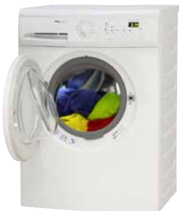
IKEA Renlig FWM8 Verð: 89.900 krónur

Neytendasamtökin gerðu síðast markaðskönnun á þvottavélum hinn 6. október sl. Þá voru til 148 mismunandi gerðir þvottavéla og 38 þeirra voru í gæðakönnun sem unnin var í samvinnu við ICRT. Ódýrasta vélin kostaði þá 44.995 krónur en sú dýrasta 479.900 krónur. Það vekur athygli að Hotpoint vélin kostaði þá 79.995 krónur og hefur því hækkað um 6,2%. Félagsmenn sem vilja skoða gæða- og markaðskannanir NS finna lykilorð á læstar síður neðst á bls. 2.