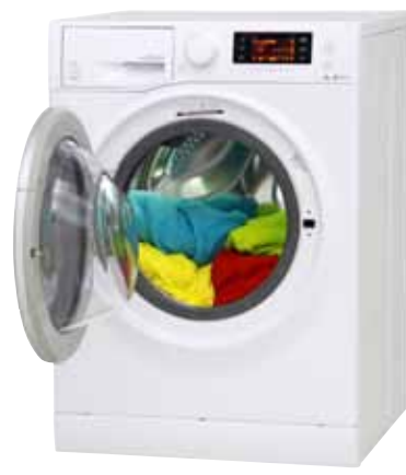
Hotpoint RPD965DDEU Verð: 84.995 krónur.

Það tekur þrjá tíma og 17 mínútur að þvo bómullarprógramm á 40 gráðum og rafmagnið sem þarf til að þvo sjö kíló af þvotti kostar 10,32 krónur.