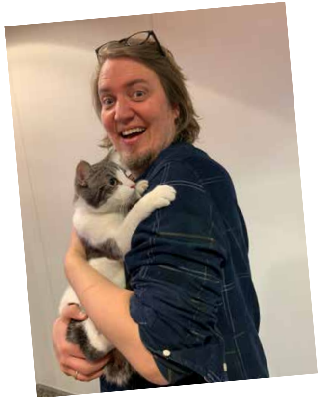
Það fór vel á með köttunum og Reyni leikstjóra.